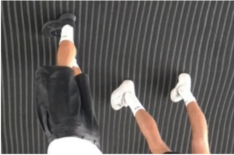
Jiajia Zhang, Beautiful Mistakes (after LB) , 2022, Videostill, HD Video, 08:58, 16:9, Farbe, Ton