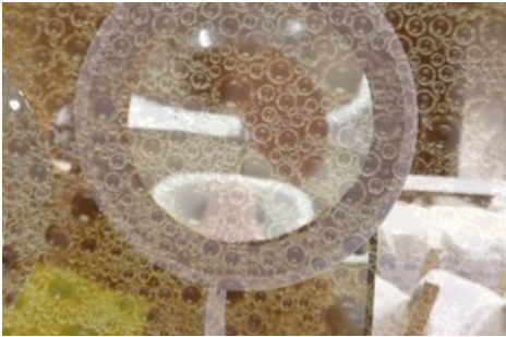
Jiajia Zhang, Beautiful Mistakes (after LB) , 2022, Videostill, HD Video, 08:58, 16:9, Farbe, Ton, Courtesy die Künstlerin