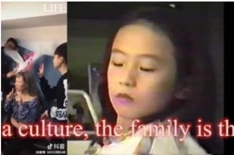
Jijia Zhang, Untitled (After Love) , 2021, Videostill, HD Video, 16:9, 16'26", Farbe, Ton, Courtesy die Künstlerin

Diese Meldung kann unter https://www.presseportal.ch/de/pm/100059306/100905280 abgerufen werden.