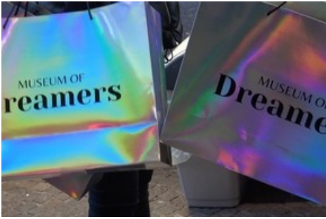
Jiajia Zhang, Social Gifts , 2023, HD Video, 16:9, 13'08", Farbe, Ton, Courtesy die Künstlerin