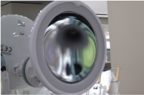
Jiajia Zhang, Beautiful Mistakes (after LB) , 2022, Videostill, HD Video, 08:58, 16:9, Farbe, Ton, Courtesy die Künstlerin