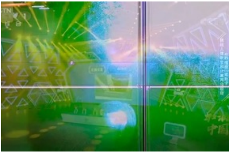
Jiajia Zhang, Between the Acts , 2022, Videostill, HD Video, 38'33", 16:9, Farbe, Ton, Courtesy die Künstlerin