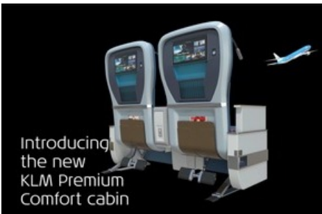
Screenshot aus dem Animationsvideo zur neuen Premium Comfort Class von KLM.