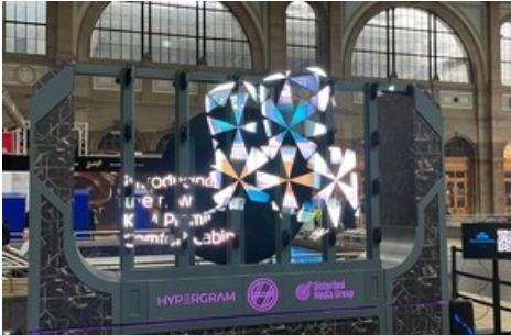
Die Premium Comfort Sitze nehmen Form an: Hologramm am Hauptbahnhof Zürich.