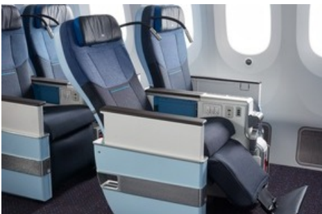
Premium Comfort Sitze