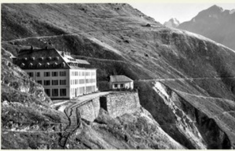
Themenweg altes Hotel Jungfrau-Eggishorn auf der Fiescheralp