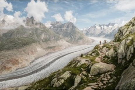
Mountainbike in der Aletsch Arena am Grossen Aletschgletscher