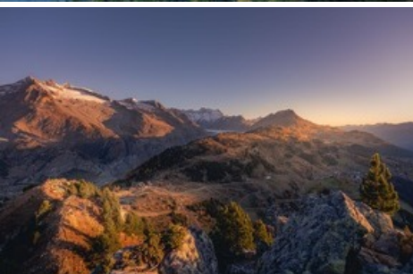
Sunset Dinner auf der Riederalp