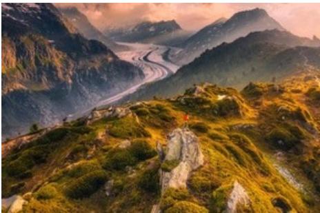
Grosser Aletschgletscher

Diese Meldung kann unter https://www.presseportal.ch/de/pm/100070233/100906224 abgerufen werden.