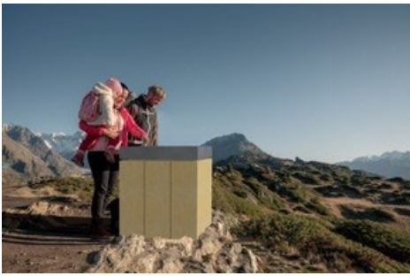
NEU Geologiesteg Moosfluh