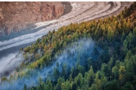
Aletschwald 90 Jahre unter Schutz (1933 - 2023)