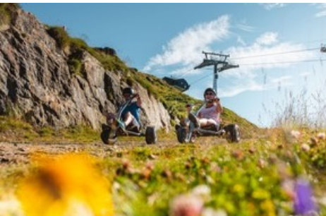
Neues Angebot: Kombiticket Mountaincart und Trobinette auf der Riederalp