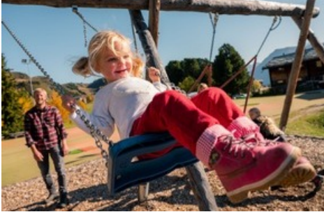
Neu gestalteter Spielplatz Baschweri auf der Bettmeralp