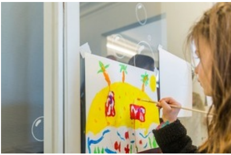
Offenes Kunstlabor, Kunstmuseum St.Gallen, Foto: Daniel Ammann