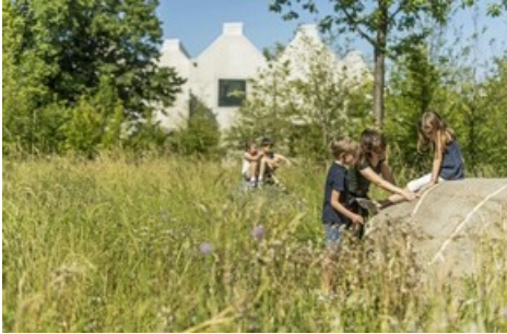
Den Park des Naturmuseums St.Gallen und die Welt der Steine erforschen, Bildquelle: Leo Boesinger