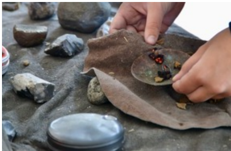
Feuermachen wie in der Steinzeit