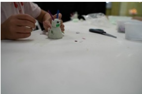
Beim Reiseziel Museum 2021 konnten im open art museum aus Spezialknete fluoreszierende Monster gebastelt werden.