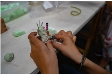
Beim Reiseziel Museum 2021 konnten im open art museum aus Spezialknete fluoreszierende Monster gebastelt werden.