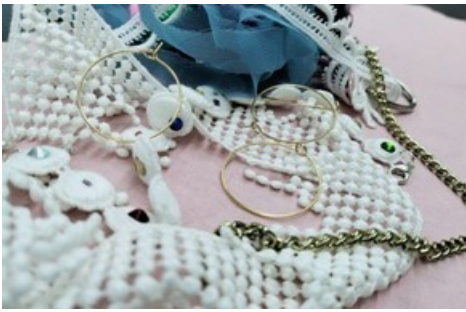
Textiler Schmuck. Workshop im Textilmuseum.

Diese Meldung kann unter https://www.presseportal.ch/de/pm/100059306/100906382 abgerufen werden.