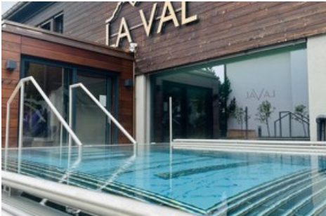
Der neue Aussenpool im La Val steht bereit für die Sommersaison

Diese Meldung kann unter https://www.presseportal.ch/de/pm/100062485/100906772 abgerufen werden.