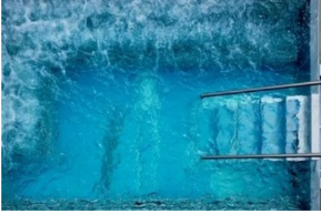
Ein kleiner Vorgeschmack auf den neuen Aussenpool im La Val