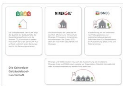
Grafik: Die Schweizer Gebäudelabel-Landschaft

Diese Meldung kann unter https://www.presseportal.ch/de/pm/100015236/100907386 abgerufen werden.