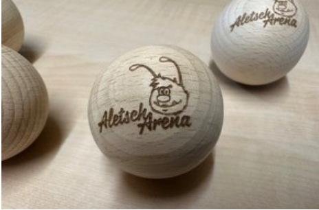
Kugeln der neuen Holzkugelbahn bei der Bättmerhütte