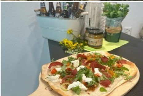
Hausgemachte Flammkuchen im Bistro Fly In am Landeplatz Fiesch