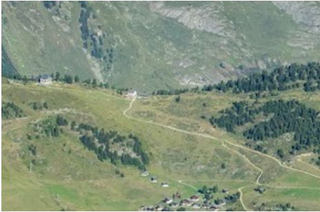
Gruppenhaus Riederfurka

Diese Meldung kann unter https://www.presseportal.ch/de/pm/100070233/100908009 abgerufen werden.