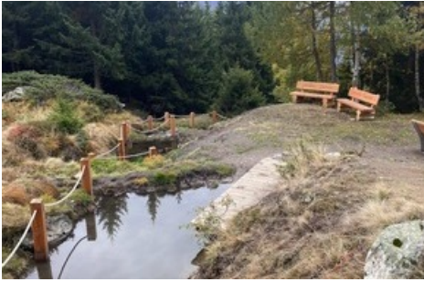
Kneipp-Anlage auf der Riederalp