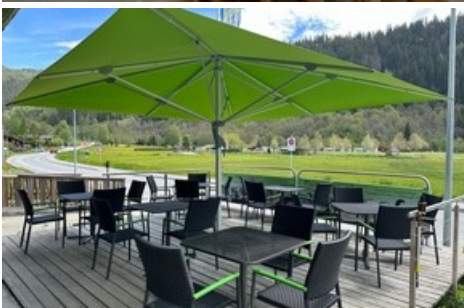
Terrasse im Bistro Fly In in Fiesch