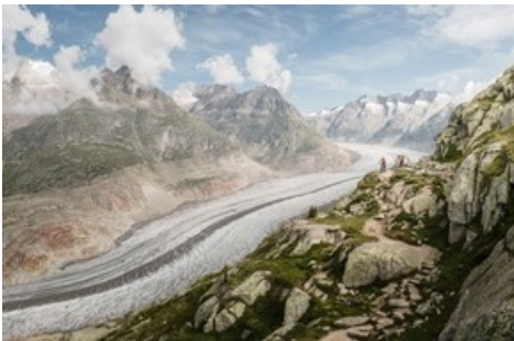
Mountainbike in der Aletsch Arena am Grossen Aletschgletscher