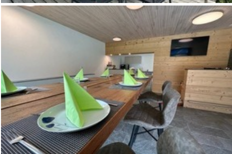
Bistro Fly In in Fiesch