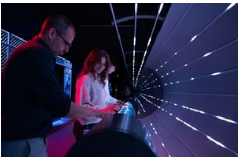
Einblick in Energieleiter und Plasmaröhre