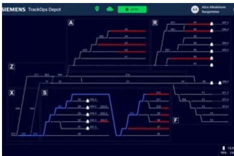
Die Rangierfahrstrassen werden nach der Anforderung des Rangierleiters automatisch eingestellt - digital und Cloud-basiert.