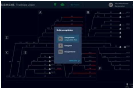
TrackOps Depot - Rollenauswahl