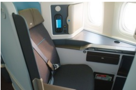
World Business Class Sitz

Diese Meldung kann unter https://www.presseportal.ch/de/pm/100018582/100908942 abgerufen werden.