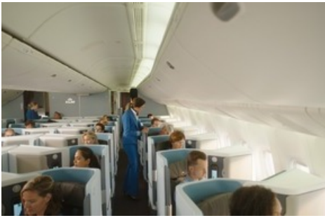
World Business Class Kabinenübersicht