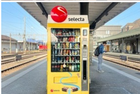
JOY TO GO Bahnhof Solothurn