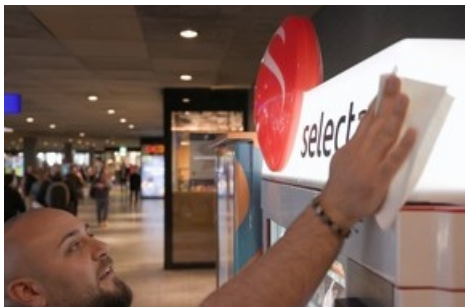
Selecta Bahnhof Bern

Diese Meldung kann unter https://www.presseportal.ch/de/pm/100001897/100909058 abgerufen werden.