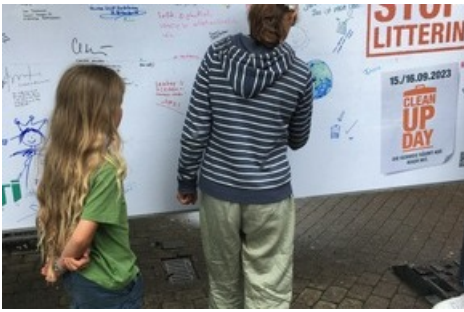
«Die Reisenden nehmen sich Zeit, um sich gegen Littering zu bekennen.»