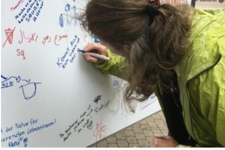
«Die Kreativität der Reisenden hat keine Grenzen.»