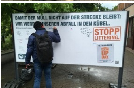
«Das IGSU-Plakat füllt sich schnell mit Illustrationen und Sprüchen.»