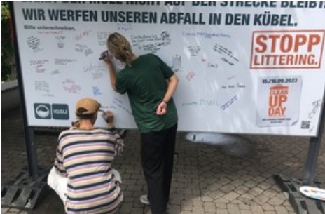
«Menschen aller Generationen lassen sich gerne auf ein Gespräch mit den IGSU-Botschafterinnen und -Botschaftern ein und halten ihre Gedanken zu Littering auf dem Plakat fest.»