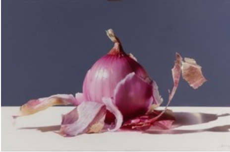
Paolo Tagliaferro, Prelibatezze di Tropea, Öl auf Leinwand, 80×40 cm

Diese Meldung kann unter https://www.presseportal.ch/de/pm/100055421/100910545 abgerufen werden.