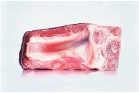
Christoph Eberle, Lamm, Öl auf Leinwand, 100×100 cm