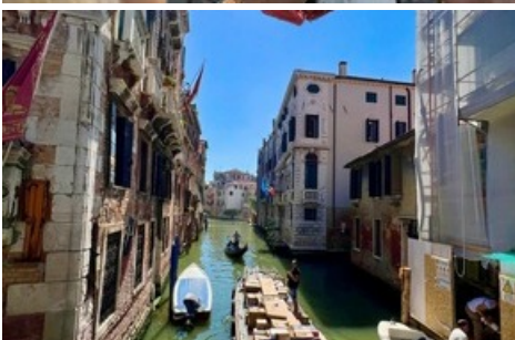
Die fliegende Skulptur in Venedig.