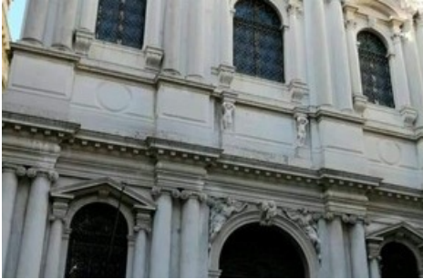
Die Ausstellung findet in der Scuola Grande San Teodoro in Venedig.