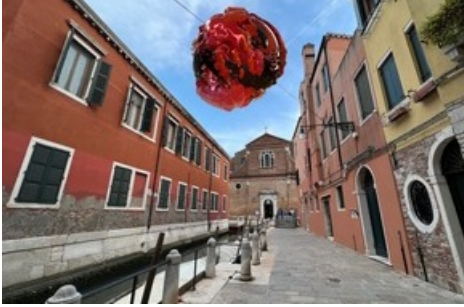
Die fliegende Skulptur von Sarah Montani in Venedig. Credit: Sarah Montani