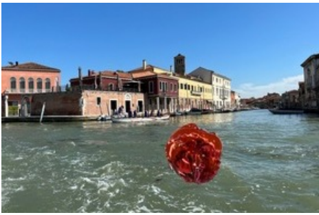
Die fliegende Skulptur in Venedig.