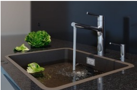
Daneo CP Unterbaubecken in Farbe Nero