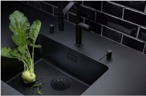
Daneo CP Unterbaubecken in Farbe Nero, mit schwarz matten Ventilbestandteilen