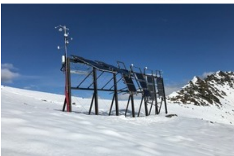
3_ Alpine Solaranlagen befinden sich im Winter normalerweise über der Hochnebel-Decke und können deshalb auch dann hohe Erträge liefern.

Diese Meldung kann unter https://www.presseportal.ch/de/pm/100018827/100912196 abgerufen werden.