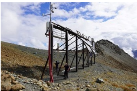
Photovoltaik-Versuchsanlage Davos-Totalp auf 2500 Metern über Meer.