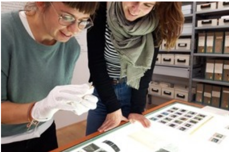
Historische Pressefotografie selber erleben: Öffentliche Termine im Schauarchiv des Ringier Bildarchivs am 16. November