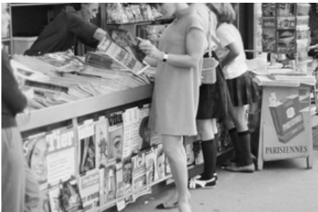
Wie gehen wir mit Informationen um? Wie arbeiten Journalist:innen? Und was wäre die Gesellschaft ohne ihren Beitrag? Bild: Junge Frau an einem Kiosk in Zürich Höngg, Oktober 1967. 1-1-9366_1

Diese Meldung kann unter https://www.presseportal.ch/de/pm/100085663/100912872 abgerufen werden.