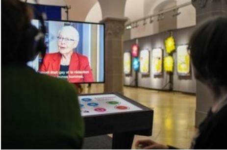
Bekannte Journalist:innen geben Einblick in Ihre Arbeit.