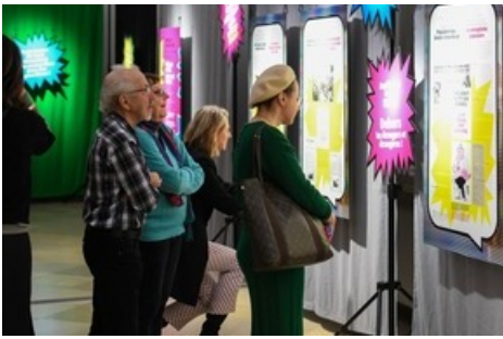
Interaktive Stationen und ein Escape-Room: Das Publikum wird selber zu Journalist:innen