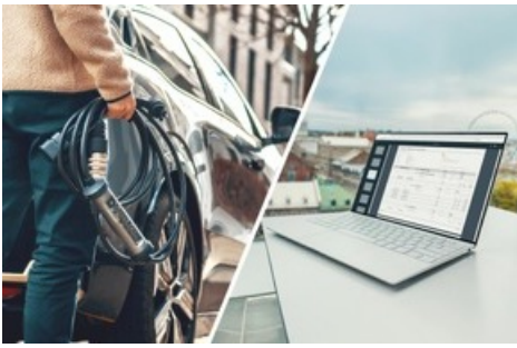
E-Flotte, das Laden zuhause und die Lösungen von Juice.