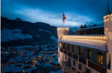
Le Gstaad Palace ouvre ses portes pour la saison d'hiver.