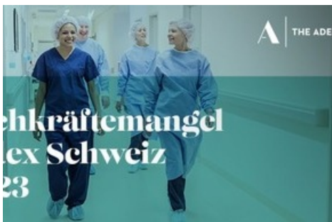
Fachkräftemangel Index Schweiz, Job Index und Arbeitslosenquote