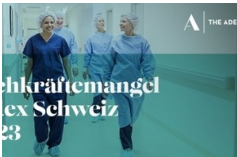
Fachkräftemangel Index Schweiz, Job Index und Arbeitslosenquote