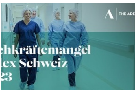
Fachkräftemangel Index Schweiz, Job Index und Arbeitslosenquote