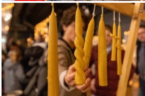
Kerzenziehen, Weihnachts-Cookies backen oder eigene Weihnachtskarten gestalten: Während den Wintermarkt-Tagen, kann man nicht nur Geschenke an den Marktständen einkaufen, man kann auch gleich selbst kreativ werden.