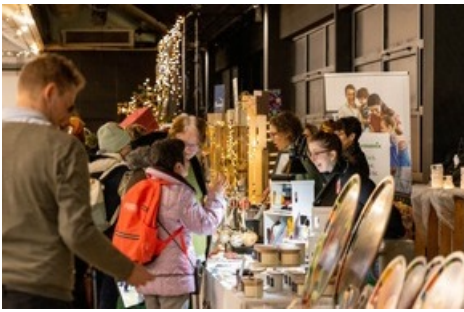
Verschiedenste Aussteller präsentieren ihre Produkte im geschmückten Innenbereich der Freiruum-Halle

Diese Meldung kann unter https://www.presseportal.ch/de/pm/100069683/100913996 abgerufen werden.