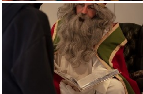
Auch der Samichlaus kommt zu besuch! Am Samstag erzählt er spannende Geschichten bei einer Märlistunde.