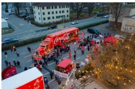
Leuchtendes Highlight am Freitag: Der Coca-Cola Weihnachtstruck steht am 8. Dezember vor dem Freiruum in Zug.