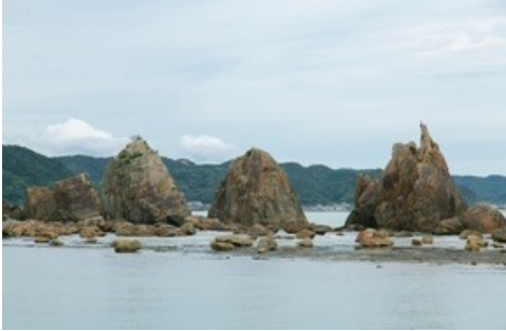
Mysteriöses Naturkunstwerk in der Küstenstadt Kushimoto, dort wo der nachhaltige Fisch gezüchtet wird (Kushimoto)

Diese Meldung kann unter https://www.presseportal.ch/de/pm/100018582/100914060 abgerufen werden.