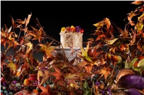
Entsteht am Tisch dank Mikrohefen: das «Brot des Waldes» von Starkoch Yoshihiro Narisawa aus Tokio