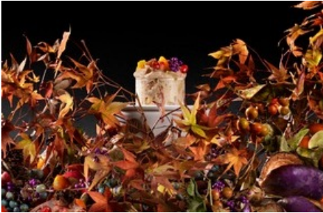
Entsteht am Tisch dank Mikrohefen: das «Brot des Waldes» von Starkoch Yoshihiro Narisawa aus Tokio (Narisawa © Sergio Coimbra)