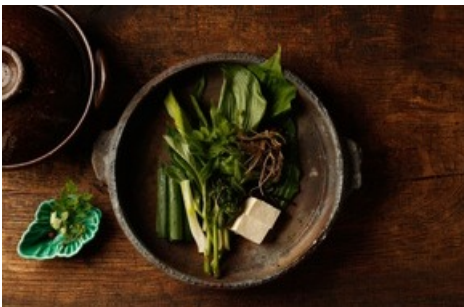
Ein Leckerbissen: Satoyama Jujo Resort in Niigata