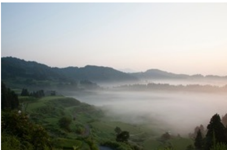
Quelle der Inspiration: Umliegende Felder und Wiesen des Satoyama Jujo Resorts in Niigata