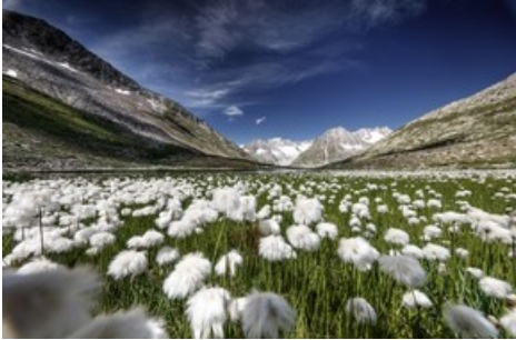
Wollgras in der Märjela oberhalb des Grossen Aletschgletschers - ein Naturerlebnis