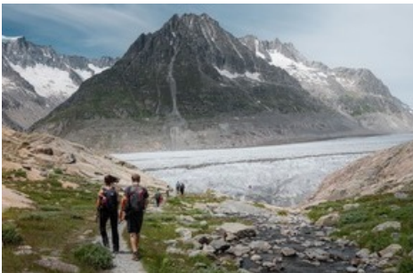
Wanderung zum Märjelensee und zum Gletscherrand