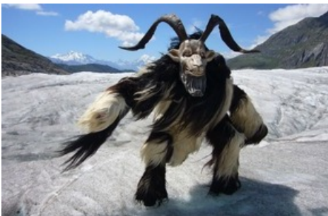
Die Sagengestalt Rollibock www.rollibock.ch oder www.aletscharena.ch/rollibock