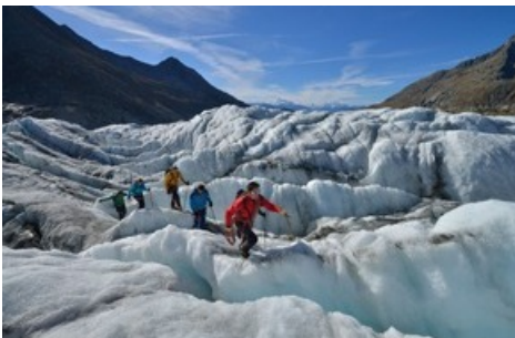
Bei geführten Gletschertouren geht es vorbei an gurgelnden türkisfarbenen Bächen, tiefen Spalten und imposanten Gletschertischen. Die Seilschaften sind Erlebnisse, die unvergessen bleiben.