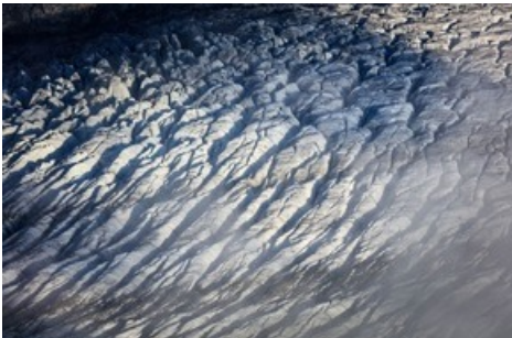
Der Grosse Aletschgletscher - mit seinen 20 km Länge ein Eisgigant