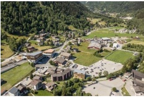
Das Freilichtspiel findet in Fiesch bei der Lischmatta statt mit direkter Anbindung an den öffentlichen Verkehr / öv-Hub Fiesch