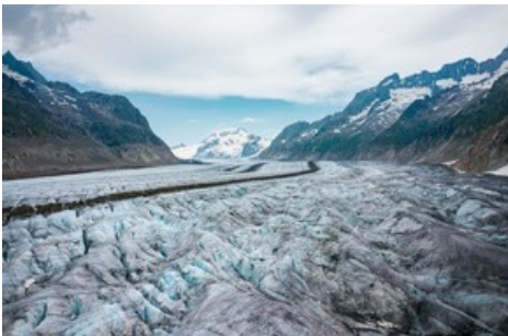
Der Grosse Aletschgletscher - grösster Gletscher der Alpen