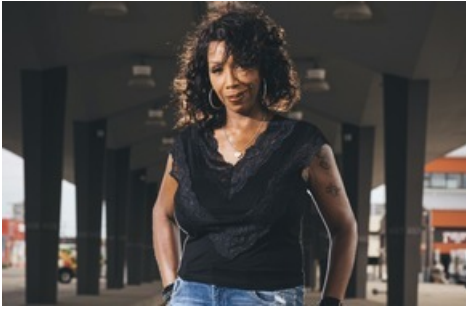
DJ Minx

Diese Meldung kann unter https://www.presseportal.ch/de/pm/100055421/100915178 abgerufen werden.