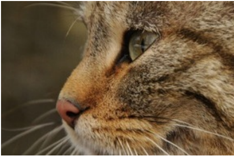
Hauskatze oder Wildkatze? Äusserlich sind die beiden zum Verwechseln ähnlich!