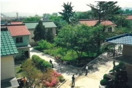
Foto aus dem Jahr 1982 des SOS-Kinderdorfes in Daegu, Südkorea.

Diese Meldung kann unter https://www.presseportal.ch/de/pm/100004403/100916070 abgerufen werden.