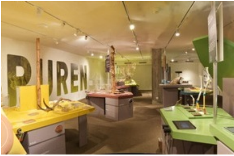
Der Natur auf der Spur im Naturmuseum Solothurn.