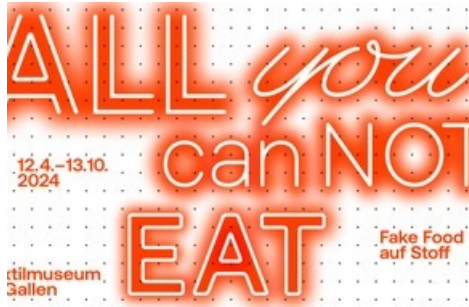
All You CanNOT Eat. Fake Food auf Stoff. Eine Ausstellung im Textilmuseum St.Gallen (12.4.-13.10.24).