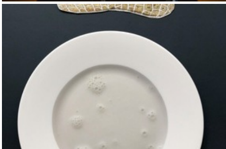
"Überreste". 7 Teller, gestaltet von Estelle Gassmann, nach 7 Broten von Terézia Krnáčová. (c) Estelle Gassmann, Terézia Krnáčová