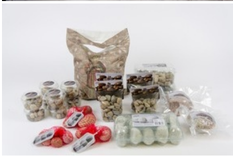
"Steine zum Anbeissen".