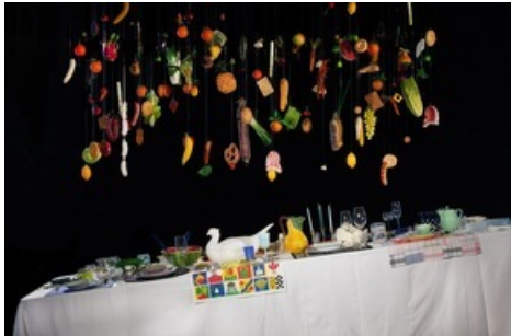
"Tischgesellschaft". © Lisa Schöpflin, Jana Besimo, Valerie Ehrenbold