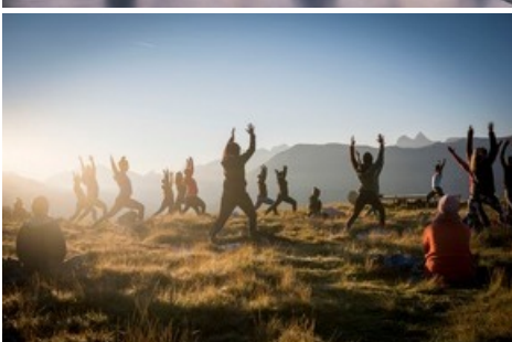
Yoga in verschiedenen Varianten, Meditationen, Workshops, Musik, Zeremonien