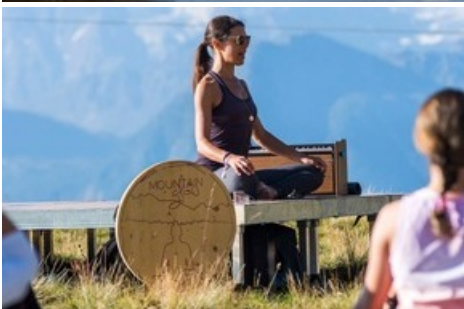
Meditieren, um den Geist zu beruhigen und die innere Ruhe zu fördern.