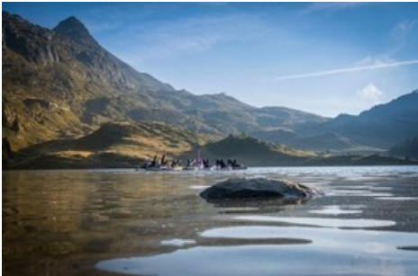
SUP-Yoga kombiniert Stand-up Paddleboarding mit Yoga auf dem See.