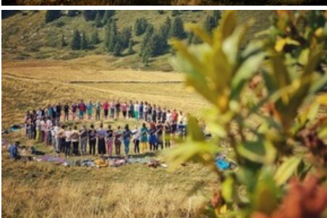
Das Mountain Glow Yoga Festival findet in atemberaubender Bergkulisse statt