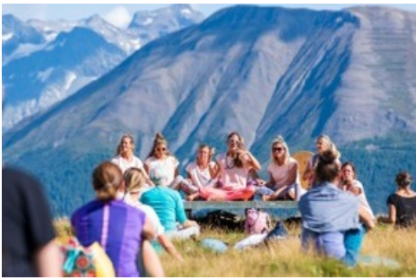
Meditation auf Aussichtsplattformen mit Blick auf über 40 4000er und den längsten Eisstrom der Alpen