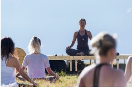
Über 20 Lehrer werden an mehr als 30 Stunden die verschiedensten Varianten des Yoga sowie Meditationstechniken unterrichten