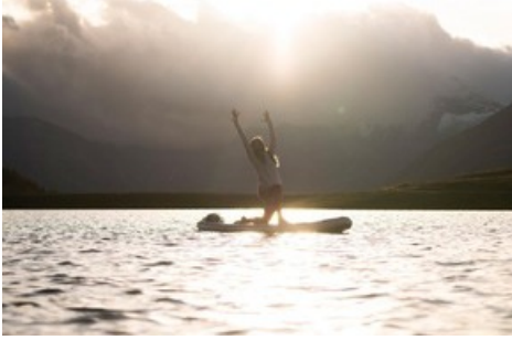
Mountain Glow Festival