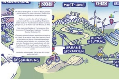
BILD zu OTS - Cover samt Rückseite mit Illustration von Robert Six