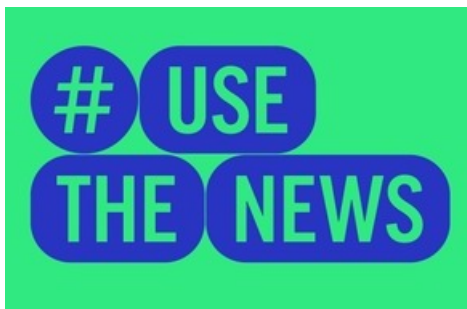
Weiterer Text über ots und www.presseportal.ch/de/nr/100014224 / Die Verwendung dieses Bildes für redaktionelle Zwecke ist unter Beachtung aller mitgeteilten Nutzungsbedingungen zulässig und dann auch honorarfrei. Veröffentlichung ausschließlich mit Bildrechte-Hinweis.

Diese Meldung kann unter https://www.presseportal.ch/de/pm/100014224/100917852 abgerufen werden.