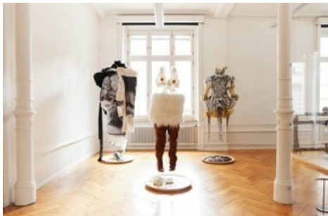
All You canNOT Eat. Fake Food auf Stoff/ All You canNOT Eat. Fake Food on Fabric. Textilmuseum St.Gallen, 12.4.-13.10.2024.