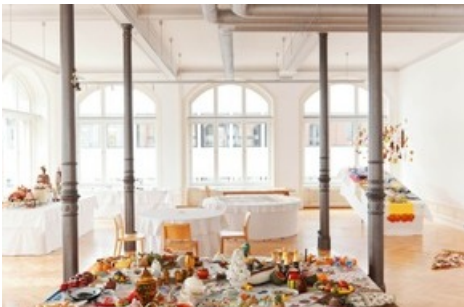
The Beloved and the Despised. Installation Madame Europe. All You canNOT Eat. Fake Food auf Stoff/ All You canNOT Eat. Fake Food on Fabric. Textilmuseum St.Gallen, 12.4.-13.10.2024.