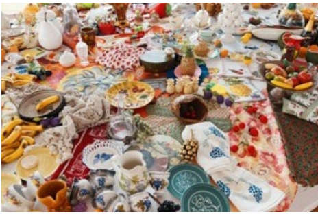
The Beloved and the Despised. Installation Madame Europe. All You canNOT Eat. Fake Food auf Stoff/ All You canNOT Eat. Fake Food on Fabric. Textilmuseum St.Gallen, 12.4.-13.10.2024