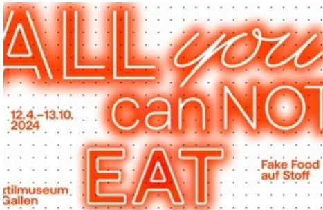
All you CanNOT eat. Fake Food auf Stoff. Textilmuseum St.Gallen (12.4.-13.10.2024). Key Visual TGG Visuelle Kommunikation