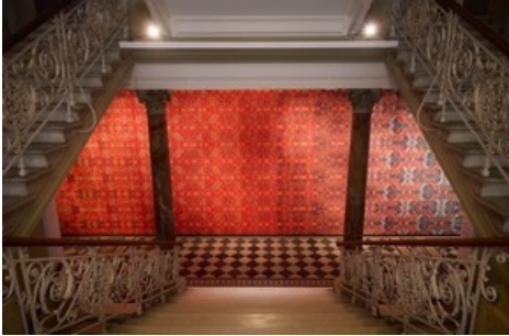
Treppenhaus Textilmuseum St.Gallen, Wandgestaltung Début Début / Staircase Textile Museum St.Gallen, wall design Début Début. All You canNOT Eat. Fake Food auf Stoff/ All You canNOT Eat. Fake Food on Fabric. Textilmuseum St.Gallen, 12.4.-13.10.2024