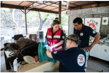
Expertinnen und Experten von VIER PFOTEN waren in Pakistan unermüdlich im Einsatz, um schwer misshandelte Bären medizinisch zu versorgen.

Diese Meldung kann unter https://www.presseportal.ch/de/pm/100004691/100918242 abgerufen werden.