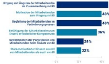
Herausforderungen in der Führung von Mitarbeitenden beim Einsatz von KI n = 972 (alle Befragten); 05 der drei wichtigsten Aspekte

Hays HR-Report 2024: Herausforderungen in der Mitarbeiterführung beim Einsatz von KI / Weiterer Text über ots und www.presseportal.de/nr/63173 / Die Verwendung dieses Bildes für redaktionelle Zwecke ist unter Beachtung aller mitgeteilten Nutzungsbedingungen zulässig und dann auch honorarfrei. Veröffentlichung ausschließlich mit Bildrechte-Hinweis.