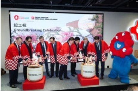
Sake-Fässer zerschlagen – in Anwesenheit des offiziellen Maskottchens Myaku Myaku.

Diese Meldung kann unter https://www.presseportal.ch/de/pm/100085676/100918416 abgerufen werden.