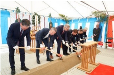
März 2024: Spatenstich in Yumeshima Osaka