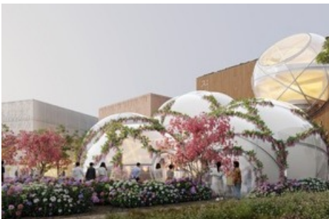
Aussenansicht: Schweizer Pavillon Expo 2025 Osaka (Visualisierung: Bellprat Partner, Manuel Herz Architekten)