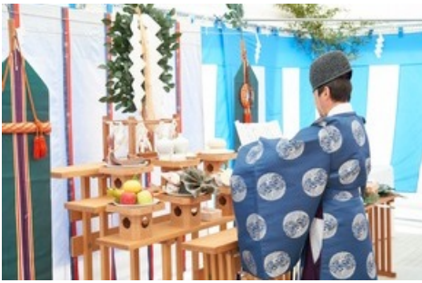
Shinto Priester während der Zeremonie