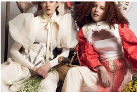
FolkloreRevisited - Jahresprojekt Gruppenbild