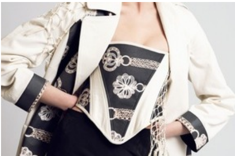
FolkloreRevisited by Fabiola Näf