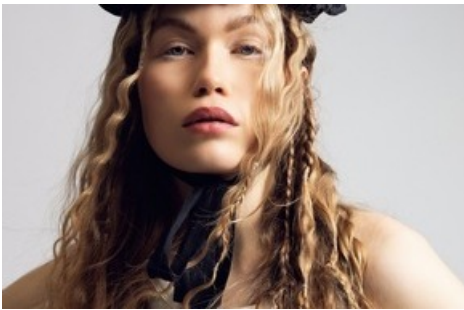
FolkloreRevisited by Claudia Leupi