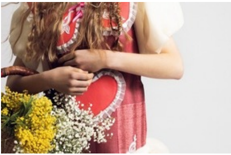
FolkloreRevisited by Meret Witschi