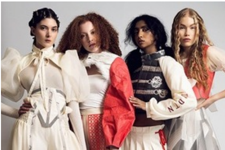
STF Fashionshooting Jahresprojekt «Folklore Revisited»