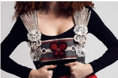
FolkloreRevisited by Vera Eigenmann