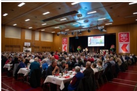
Die PS-Versammlung 2024 in der Mehrzweckhalle Turmatt in Stans.