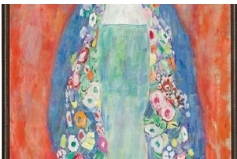
Das Auktionshaus im Kinsky präsentiert ein wiederentdecktes Spitzenwerk der österreichischen Moderne: Das „Bildnis Fräulein Lieser“ von Gustav Klimt