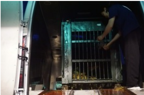
Für Chinh beginnt nun dank der Rettung durch VIER PFOTEN ein neues Leben.

Diese Meldung kann unter https://www.presseportal.ch/de/pm/100004691/100919508 abgerufen werden.