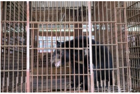
Kragenbär Chinh lebte bis anhin in einem winzigen Käfig und konnte sein natürliches Verhalten nicht ausleben.