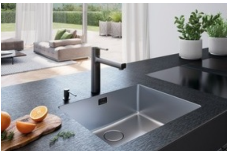
Suter Neuheiten: Xrange Black