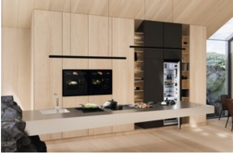
BORA – more than cooking. Entdecken Sie die innovativen Neuheiten von BORA in der ersten BORA-Welt der Schweiz.