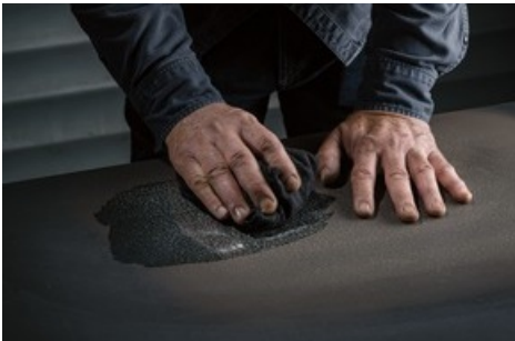
Massanfertigung im Werk in Schinznach-Bad