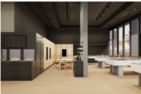
3-D-Visualisierung der Ausstellung in Crissier