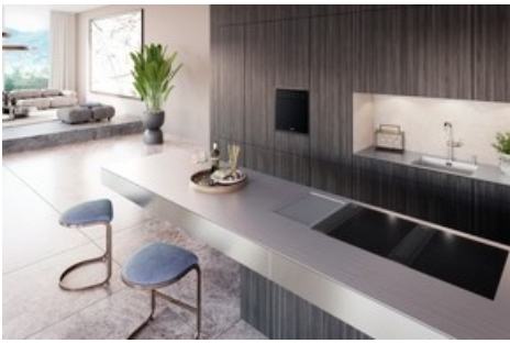
Warmgewalzte Spezialoberfläche, Einbaugeräte BORA