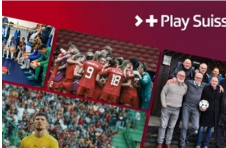
Weiterer Text über ots und www.presseportal.ch/de/nr/100014224 / Die Verwendung dieses Bildes für redaktionelle Zwecke ist unter Beachtung aller mitgeteilten Nutzungsbedingungen zulässig und dann auch honorarfrei. Veröffentlichung ausschließlich mit Bildrechte-Hinweis.

Diese Meldung kann unter https://www.presseportal.ch/de/pm/100014224/100920435 abgerufen werden.