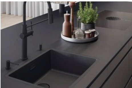
Flächenbündiges Linero Cristadur Puro Becken in der Ausführung Black Edition mit schwarzen, DEC-beschichteten Ventilbestandteilen