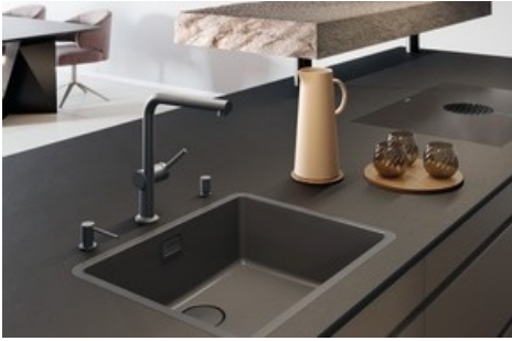
Flächenbündiges Linero Cristadur Stone Becken mit Raumspar Desino und PVD-beschichteten Ventilbestandteilen in der Farbe Graphit