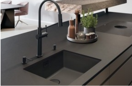
Linero Cristadur Puro Unterbaubecken in der Ausführung Black Edition mit schwarzen, DEC-beschichteten Ventilbestandteilen

Diese Meldung kann unter https://www.presseportal.ch/de/pm/100096608/100920798 abgerufen werden.