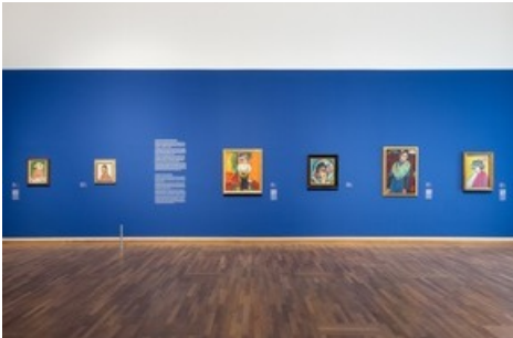
BILD zu OTS - Leopold Museum: Ausstellungsansicht Fokusausstellung "Deutscher Expressionismus" im Rahmen der permanenten Präsentation "Wien 1900. Aufbruch in die Moderne". Im Foto zu sehen sind Werke (v.l.n.re.) von August Macke, Paula Modersohn-Becker, Max Pechstein, Alexej von Jawlensky und Gabriele Münter