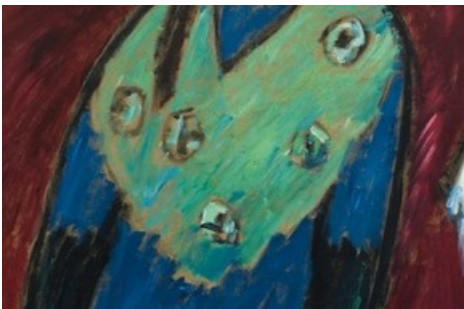
BILD zu OTS - Alexej von Jawlensky (1864–1941), Mädchen mit grüner Stola, 1909/10, Öl auf Hartfaserplatte, 96 x 65 cm, Renate und Friedrich Jochenning Stiftung, Düsseldorf