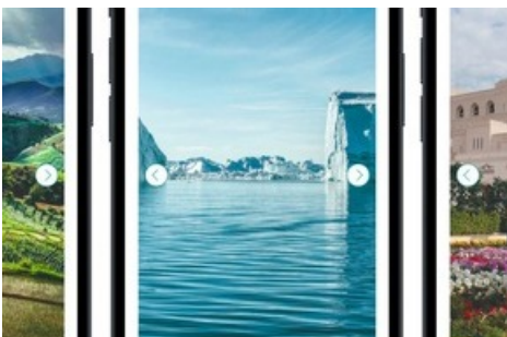
Launch background.ch (Mobile)