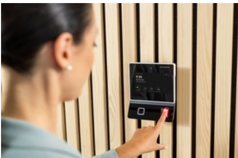
Arbeitszeiten erfassen am Zeiterfassungsterminal 96 00 von dormakaba