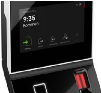
Neues Zeiterfassungsterminal 96 00 von dormakaba