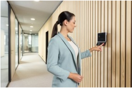
Arbeitszeiten erfassen am Zeiterfassungsterminal 96 00 von dormakaba