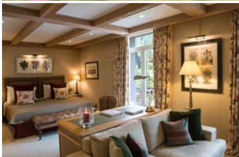
Classic Junior Suite mit Fernblick.