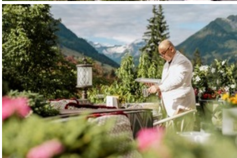
Auf der La Grande Terrasse eröffnet sich der Blick auf die magische Bergkulisse.