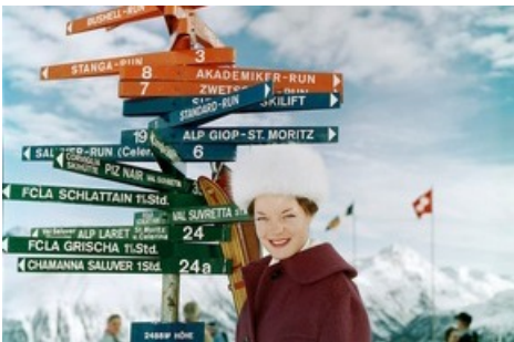
Schauspielerin Romy Schneider auf der Corviglia, Februar 1960.