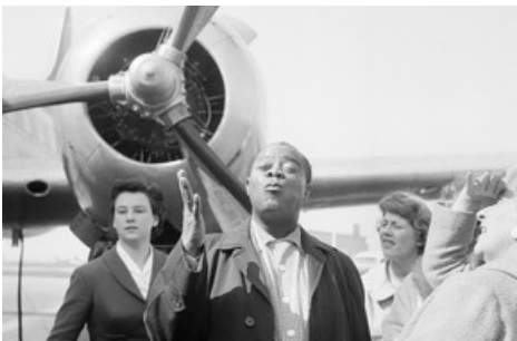
Louis Armstrong bei seiner Ankunft in Kloten, 1962.