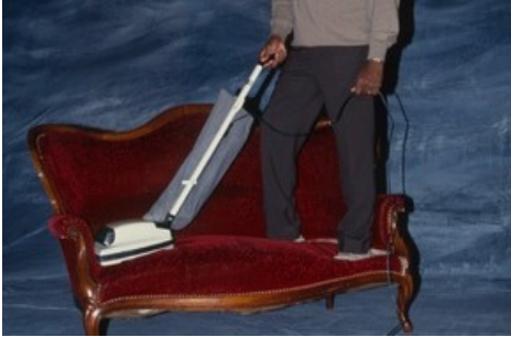
Aus der Serie «Prominente mit Dingen, die sie nie wegwerfen». Sänger Simon Estes mit seinem Staubsauger, November 1992.