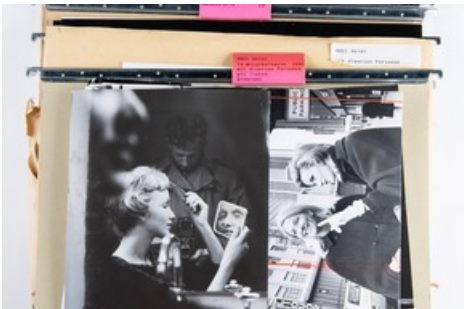
Beispiel Personendossiers aus dem Ringier Bildarchiv