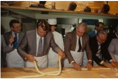
Zopfbacken mit dem Bundesrat, Juni 1989.