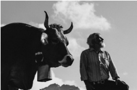
Raclette aus Walliser Alpenmilch