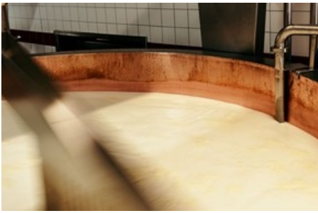
Cremiger Käsegenuss