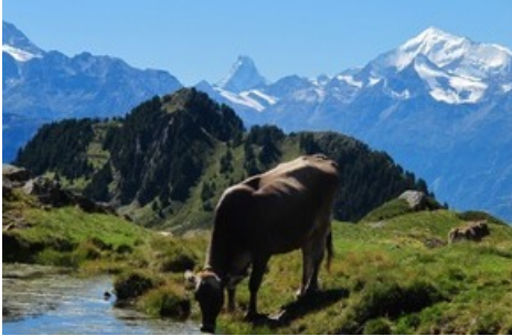
Aletsch Arena im Sommer